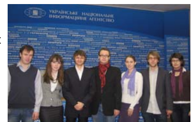
Молодіжні та студентські організації України об'єдналися, аби захистити демократичну реформу освіти

Співкоординатори Громадянської кампанії «За освічену Україну: вступ без хабаря!» також виступили із закликом до абітурієнтів, вчителів шкіл, батьківських комітетів не залишатись осторонь та залучатися до діяльності цієї громадської ініціативи.