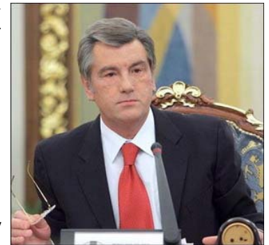
Президент України Віктор Ющенко підписав зміни до ЗУ "Про вищу освіту" щодо питань студентського самоврядування

3. Фінансовою основою студентського самоврядування є кошти, визначені Вченою радою вищого навчального закладу, у розмірі не менше 0,5 % коштів спеціального фонду відповідного вищого навчального закладу. Кошти органів студентського самоврядування спрямовуються на виконання їх завдань і повноважень. Не менше як 30 % коштів мають витратитися на підтримку наукової діяльності осіб, які навчаються у відповідному вищому навчальному закладі.