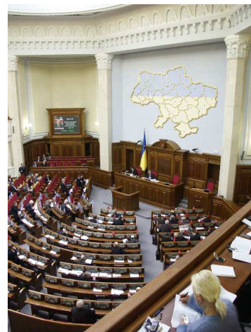
Верховна Рада України прийняла зміни до ЗУ "Про вищу освіту" щодо питань студентського самоврядування

Нагадаємо, у грудні низка молодіжних та студентських організацій, серед яких Всеукраїнська студентська рада при МОН України, ВМГО «Українська асоціація студентського самоврядування», ВМГО «Фундація регіональних ініціатив», «Спілка ініціативної молоді», Студентська рада Києва наголошували на необхідності даного закону, обіцяючи масові студентські протести у разі його неприйняття.